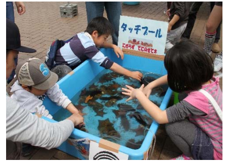
【グリーントライアスロンでの環境活動の様子】