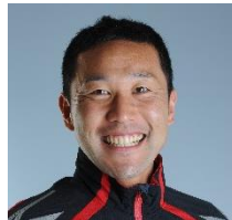
田山 寛豪 (たやま ひろかつ) 選手

2004アテネオリンピック日本代表 2008北京オリンピック日本代表 2012ロンドンオリンピック日本代表 2016リオデジャネイロオリンピック日本代表