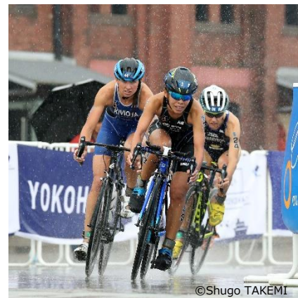
上田藍 -Ai Ueda- (写真中央) リオデジャネイロオリンピック日本代表 2016年 世界トライアスロンシリーズ横浜大会 3位 2016年 ITU世界トライアスロンシリーズ 年間ランキング 3位

本大会の詳細は、大会HPをご確認ください。 https://yokohamatriathlon.jp/wts/