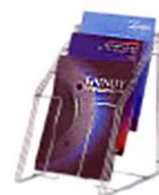
卓上カタログスタンド @4,500