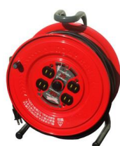
ドラムコード (30m) @1,800