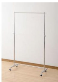
ハンガーラック ※荷重30kg @4,000