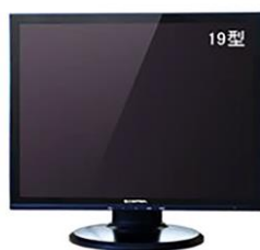
液晶テレビ（19インチ） @35,000