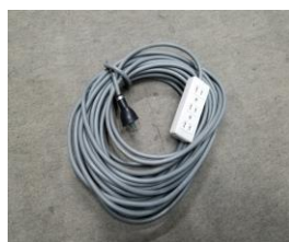
延長コード (20m) @1,500